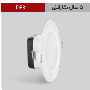
DE31 ۵ سال گارانتی