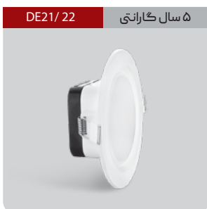
DE21/ 22 ۵ سال گارانتی