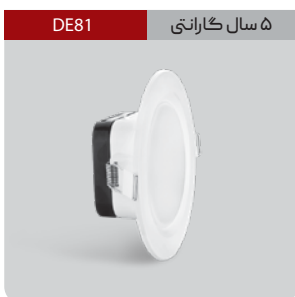
DE81 ۵ سال گارانتی