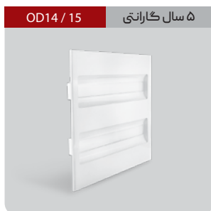
OD14 / 15 ۵ سال گارانتی