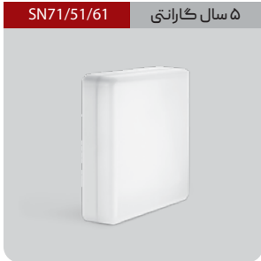
۵ سال گارانتی SN71/51/61