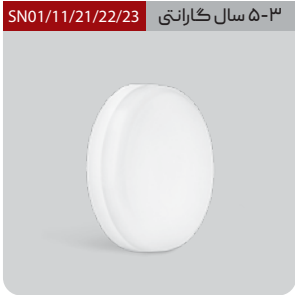
۳-۵ سال گارانتی SN01/11/21/22/23