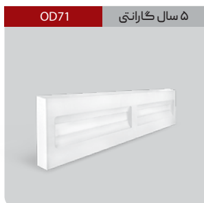
OD71 ۵ سال گارانتی