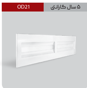
OD21 ۵ سال گارانتی