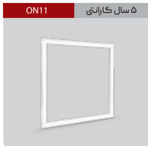
ON11 ۵ سال گارانتی