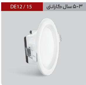
DE12 / 15 ۳-۵ سال گارانتی