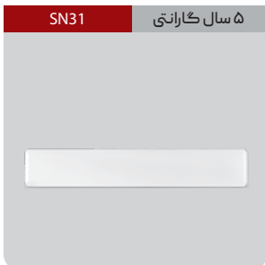
۵ سال گارانتی SN31