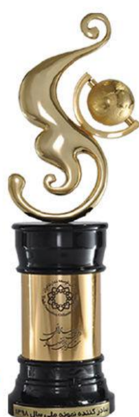
صادر کننده نمونه ملی