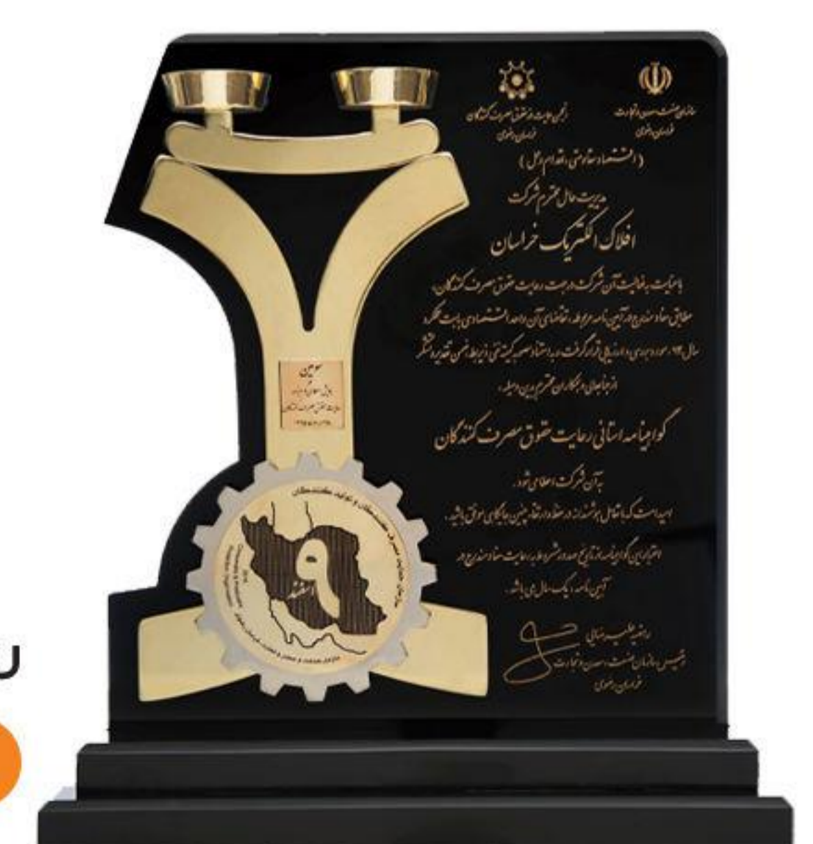
رعایت حقوق مصرف کنندگان