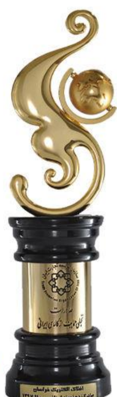
صادر کننده نمونه استانی ۸ سال متوالی